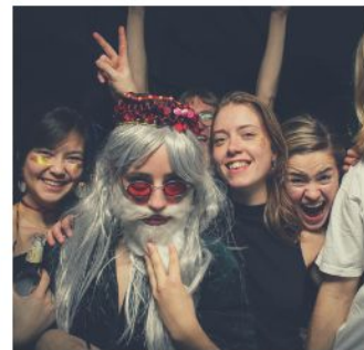
The best club: FOXEN