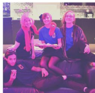
My first NATU event