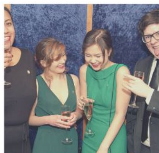
One of many Novisch partys