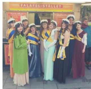
Marskalkeriet vt 16